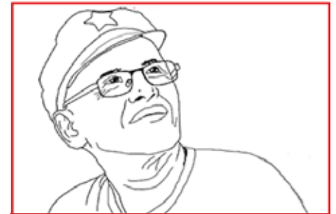
MGA KWENTO NI KA MADAAY GASIC

Inilantad ng kahirapan at kagutuman ng Mindoreño ang naghuhumiyaw na kapabayan at kawalan ng matinong programa sa paglutas sa problema sa lupa, pagkaatrasado ng